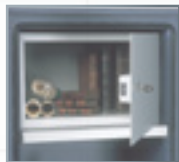
Equipements intérieurs (en partant de la gauche) : tablette, armoire à clé